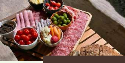
PLANCHE APÉRITIF AUX CHOIX, 4 À 6 PERS .....32 €